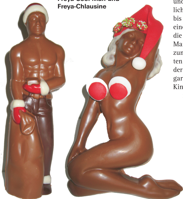
Freya Cool Man und Freya-Chlausine

Und wussten Sie, dass in der Freya die Produkte täglich in kleineren Mengen erstellt werden, um dadurch die Frischegarantie zu gewährleisten? Dass ausschliesslich Schweizer Chocolate und beste Rohstoffe verwendet werden? Dass die Freya Pralinés, Truffles und Chocolate-Spezialitäten mit viel Liebe und Hingabe von Hand gefertigt werden? Noch mehr erfahren Sie unter www.freya.ch oder direkt vor Ort. ■